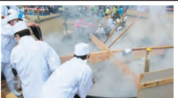
★ 奥州水沢 グルメまつり 平成23年10月16日(日) 会場:水沢公園

市民総参加を目指して厄年連や市民による甚句大パレード、江刺鹿踊りの演舞が披露されます。