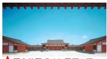
★ 歴史公園 えさし藤原の郷 平泉や奥州藤原家の時代を再現した歴史公園。広大な敷地には平安時代の建築が再現されており、まさに壮観。大河ドラマシリーズなど多くのロケに使用されています。