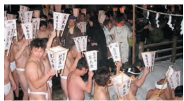
★ 黒石寺蘇民祭 平成24年1月29日(旧正月7日晩～) 会場:妙見山 黒石寺

南部鉄器のジャンボ鍋で煮込んだ、鉄分たっぷりの「いものご汁」約6,000食が無料で振る舞われ、奥州市の秋の味覚を楽しめます。