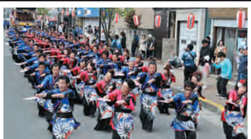
★ 第38回えさし甚句まつり 平成23年10月8日(土)・9日(日) 会場:江刺区大通り公園

奥州市の伝統工芸品である南部鉄器を4割引きで購入でき、鑄物太鼓の披露、下駄飛ばし大会などが行われます。