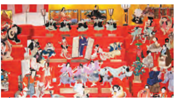
★ 奥州水沢 くり雛まつり 平成24年2月下旬～3月3日(土) 会場:メイプル、みずさわ観光物産センター、武家住宅資料館

農業の豊作と安全を祈り、日本最大級の大臼による福餅つきや、大俵を使った福俵引きなどが行われます。