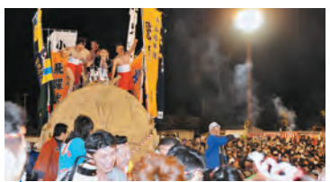
★ 全日本農はだてのつどい 平成24年2月11日(毎年2月第二土曜日) 会場:胆沢野球場 特設会場

五穀豊穡と災厄祓いを願って、裸参り、柴燈木登、別当登、鬼子登、蘇民袋争奪戦が行われる勇壮な裸祭りです。