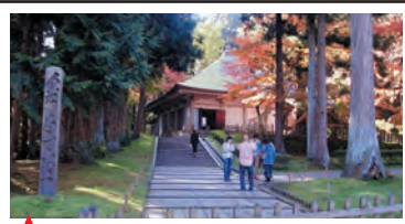
★ 中尊寺 奥州藤原氏三代ゆかりの寺として著名であり、金色堂を始め多くの文化財を所有しています。2011年6月、世界文化遺産に登録されました。