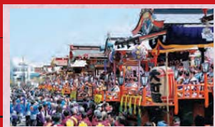
イベント 日高火防祭 [4月29日] 格調高い古趣豊かな音曲を奏でながら、雅な「はやし風台」が、艶やかに城下の町を流れます。