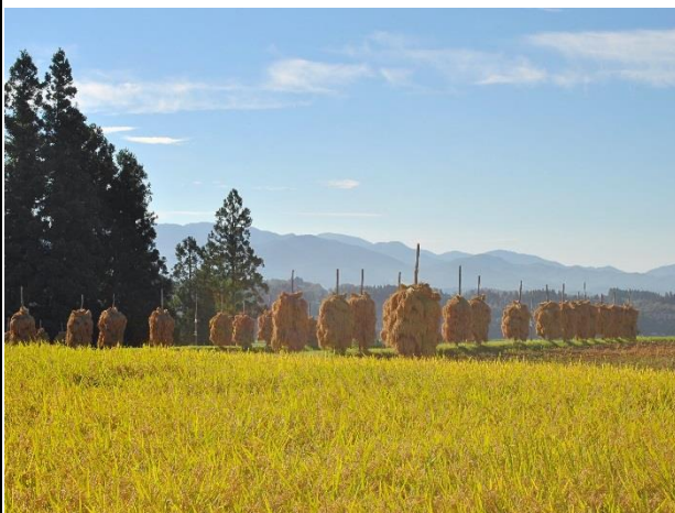
【入選】 「かわいいほんによ」（石亀彩子氏）