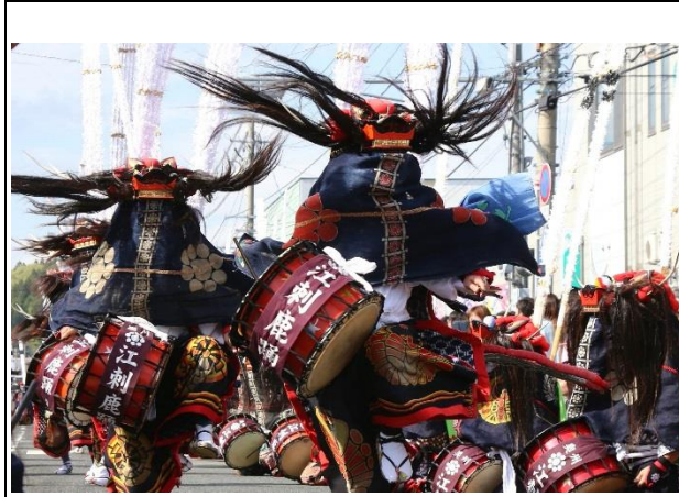
【最優秀賞】 「躍動の舞」（富澤正幸氏）