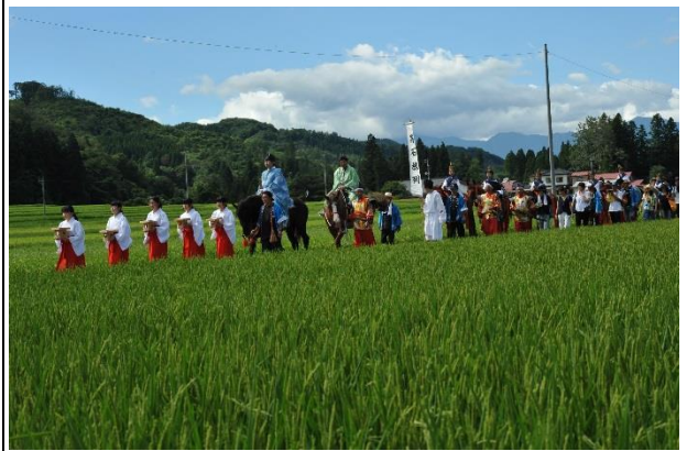
【入選】 「昔懐かしの祭り」（藤島純七氏）