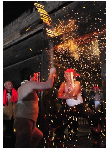
【優秀賞】 「気魄」（達下才子氏）