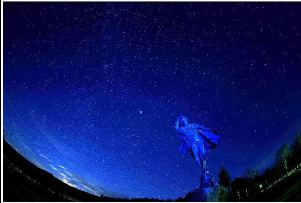
【優秀賞】 「さあ 星巡りの旅へ」（高橋貞勝氏）