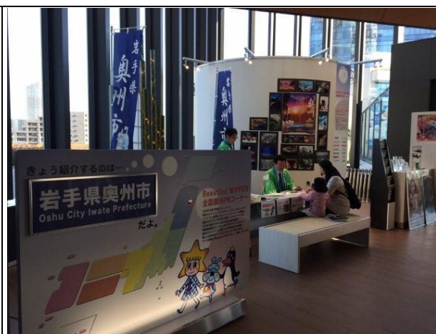
【東京スカイツリー（奥州市PR）】