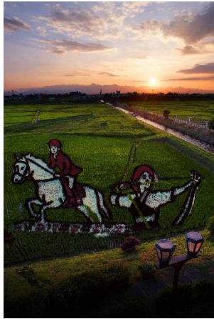
【入選】 「おらほの田んぼアート！」（齋藤純一氏）