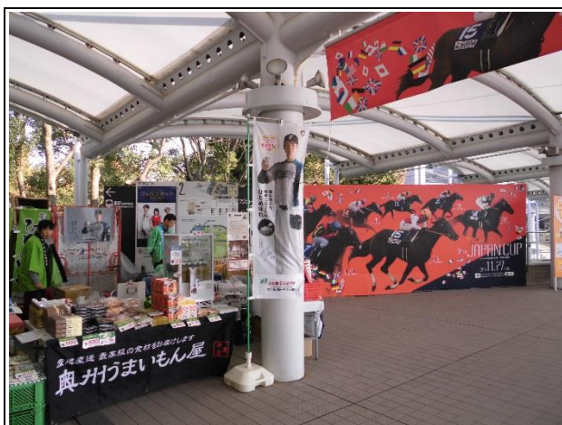
【いわて物産展 in 東京競馬場】

また、「どんとこい奥州誘客促進会議」のメンバーとして、「東京スカイツリー」における奥州市のプロモーション活動を行った。