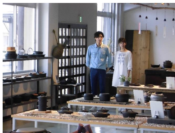
【東森電視「東森旅遊玩樂誌」取材】