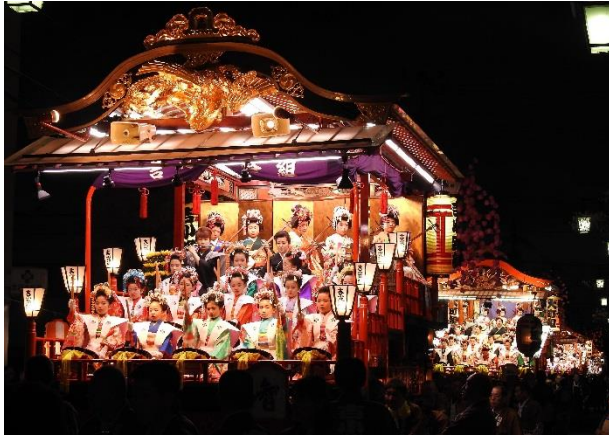
【優秀賞】 「豪華絢爛」(達下才子氏)