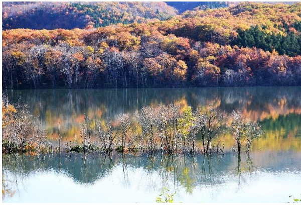
【優良賞】 「奥州湖晩秋」(河東田康昭氏)