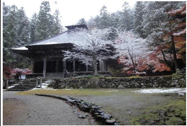
【優秀賞】 「初雪の境内」(及川文夫氏)