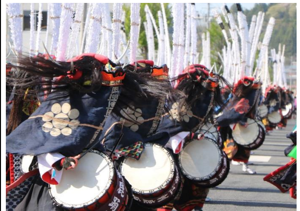
【入選】 「轟く太鼓」(大和田正光氏)