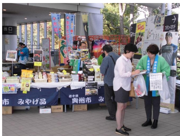
【いわて物産展 in 東京競馬場】

また、台湾の旅行エージェント招聘や旅番組の取材等（復興庁・県南広域振興局）に適宜対応したほか、「花巻空港国際チャーター便歓迎実行委員会」に加入し、メンバーとして奥州市のプロモーション活動を行った。