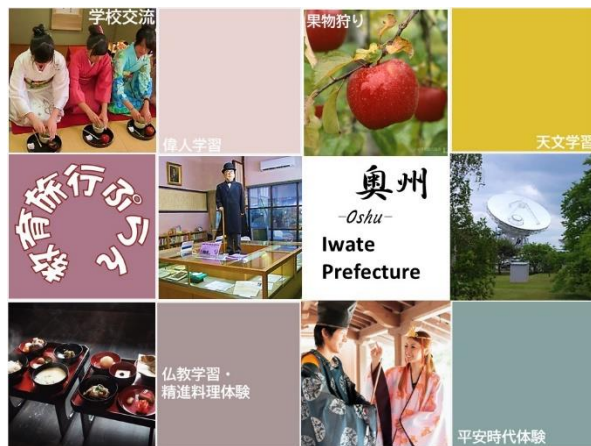
【奥州市訪日教育旅行コース（表紙①）】