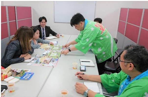
【台湾旅行エージェント訪問】

また、インバウンド誘客促進については、台湾をターゲットとして、7月には奥州市、藤原の郷と共に旅行エージェントを訪問し、秋・冬の誘客促進を図るとともに、11月の「東北プロモーション in 台湾 2019」では、台北、台中及び高雄において来春・夏の誘客に向けて商談会等に参加した。さらには、いわて花巻空港における上海便、台湾便の乗客歓迎事業に参加するとともに、岩手県南振興局が主催した台湾向けの教育旅行プランの作成に協力した。