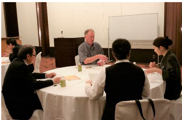
【接遇用外国語セミナー（英語）】