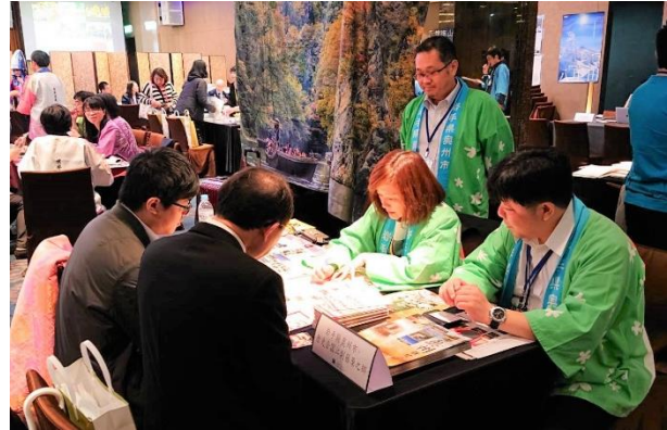
【東北プロモーション in 台湾 2019】