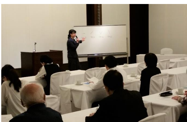
【接遇用外国語セミナー（中国語）】