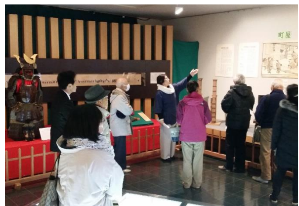
【観光サポーター研修会】