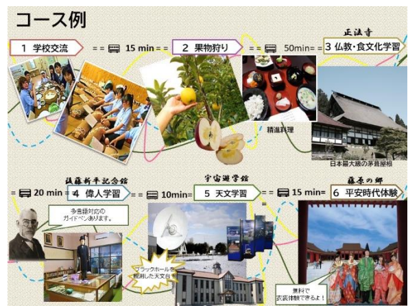
【奥州市訪日教育旅行コース（表紙②）】