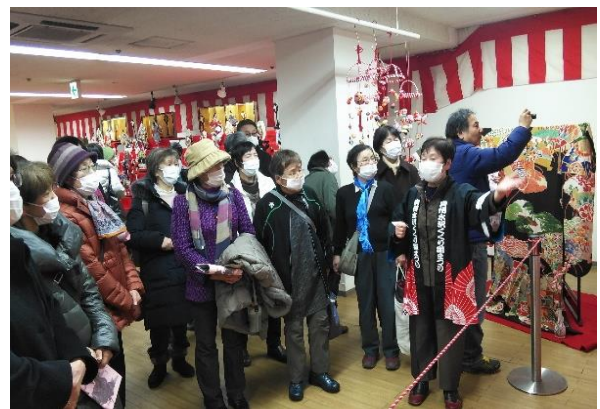
【日帰りモニターツアー】 (2/29、くくり雛まつり会場)