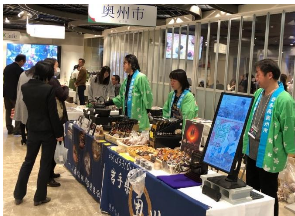
【茶文化プロジェクト】