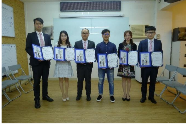
【奥州台湾観光親善アンバサダー】 (永和国際青年商会会員を任命)