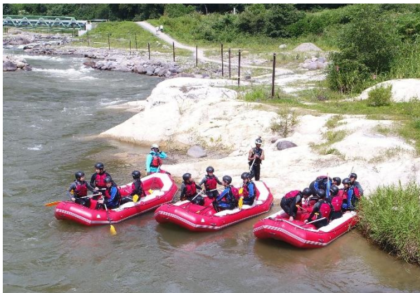
【ラフティング研修会】