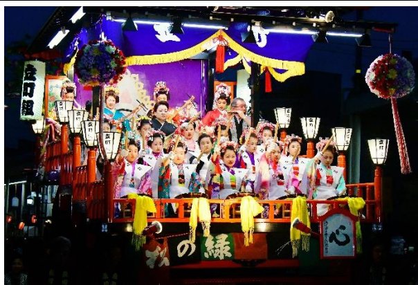
【入選】 「夜の雅やかな囃子屋台」(千田久氏)