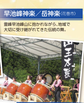
早池峰神楽 / 岳神楽 (花巻市)