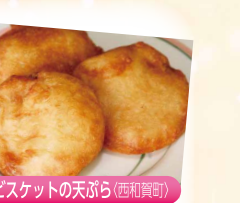
ビスケットの天ぷら (西和賀町)

主催 / 世界遺産連携推進実行委員会 (一関市・奥州市・平泉町・県南広域振興局・(一社)一関観光協会・(一社)奥州市観光物産協会・(一社)平泉観光協会・一関商工会議所・奥州商工会議所・前沢商会・平泉商工会) 共催 / めんこいテレビ