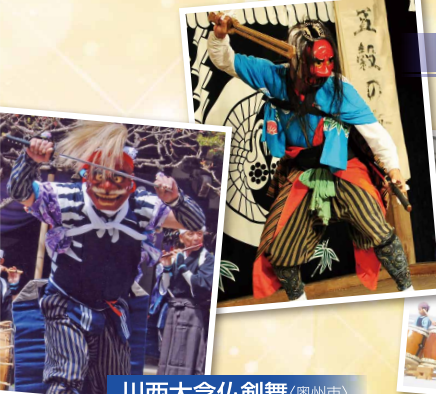
川西大念仏剣舞 (奥州市)