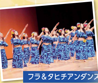
フラ&タヒチアダンス