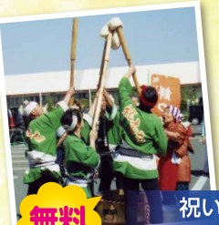
祝い餅つき振舞隊 (一関市)