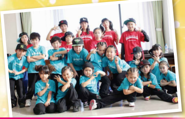
コントローラードンスカンパニー (一関市)