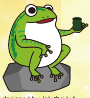
designed by センウェル

人の「声」だけで歌うアカペラコーラスグループ。 「ハモネブ」出演をきっかけに2001年12月デビュー。